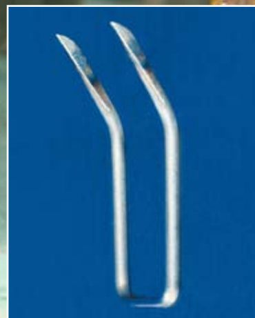
Häkchen aus oberflächenveredeltem Stahl