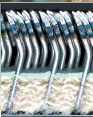
Perfekter Aufbau der Fundation